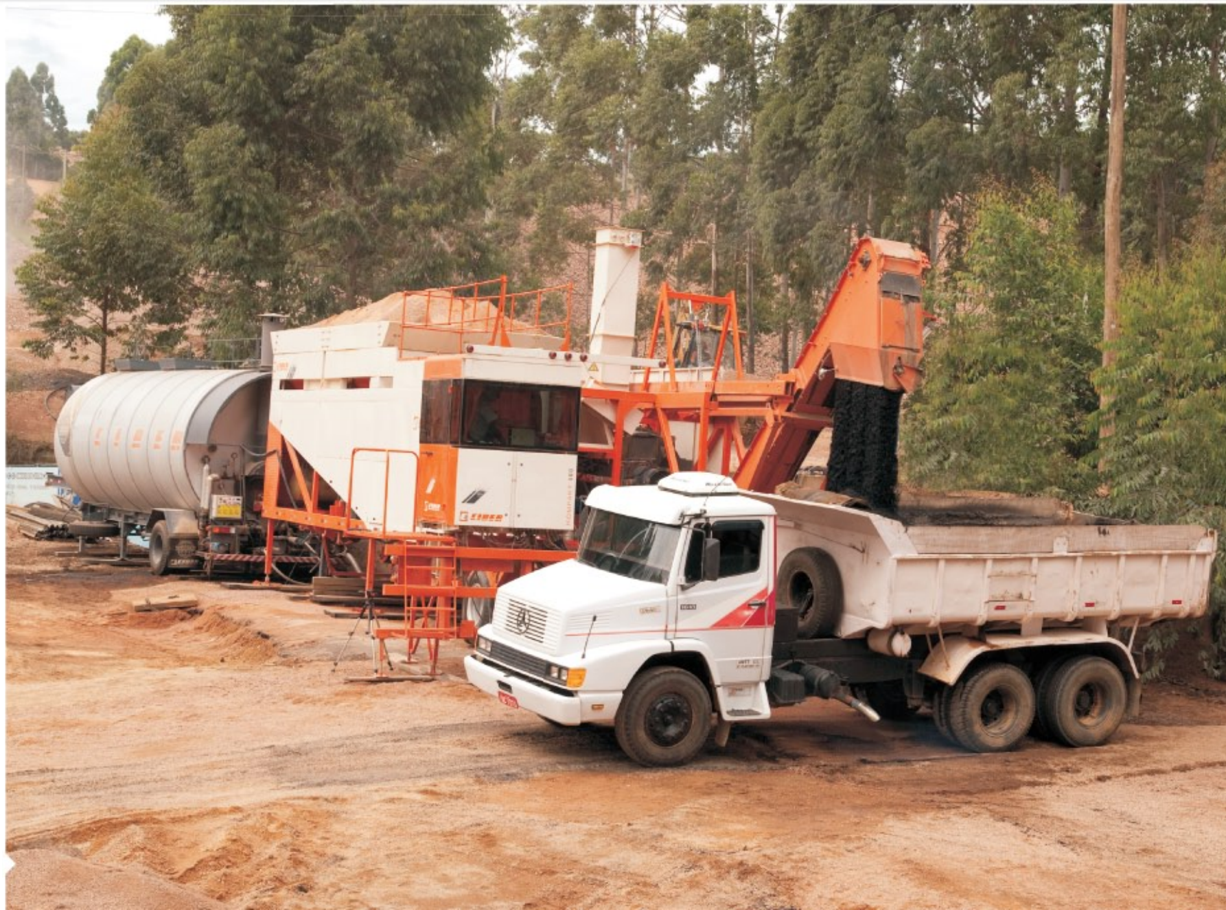
Planta KP 500